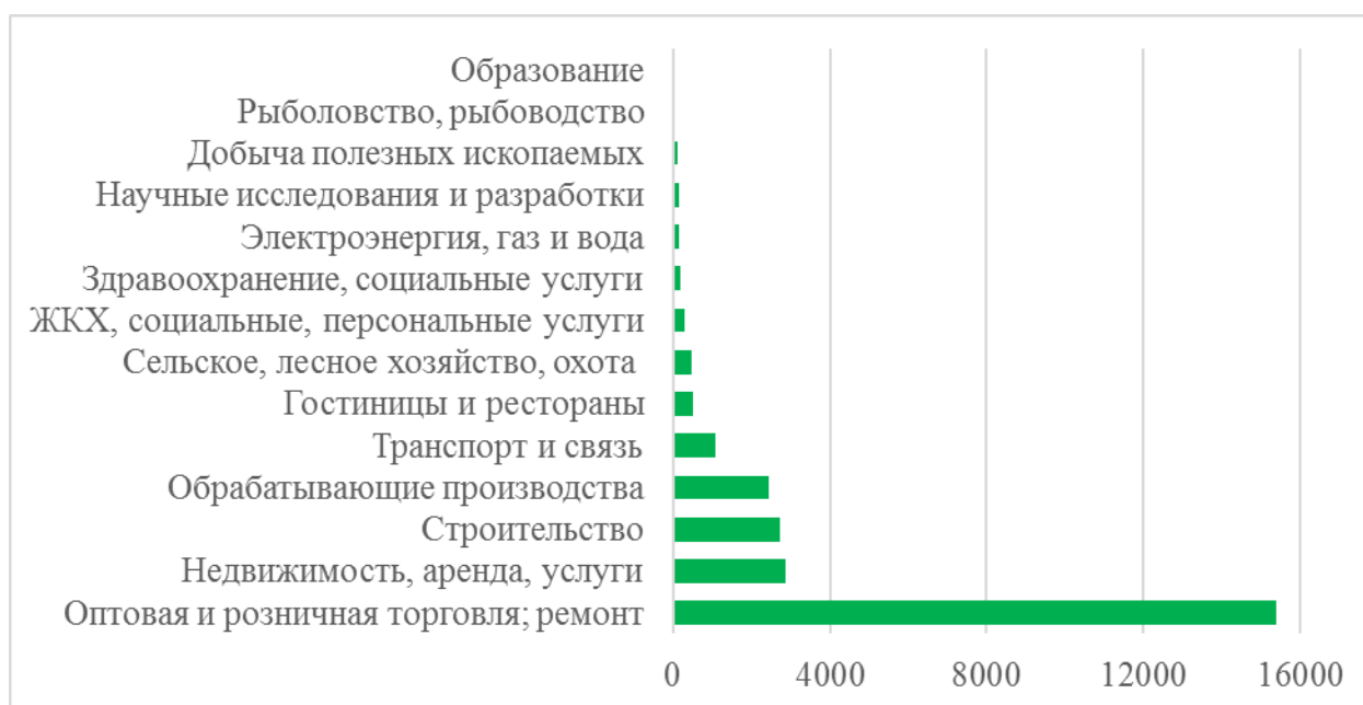
Рисунок 3 – Годовой оборот малых предприятий в 2015 г. (включая микропредприятия) по видам экономической деятельности в Российской Федерации, млрд. руб. [8]

Как видно на графиках (рис. 2 и 3), основу оборота малых предприятий в России составляет оптовая и розничная торговля (58%), а также недвижимость (11%), строительство (10%) и обрабатывающие производства (9%). Показатель доли по виду экономической деятельности в годовом обороте относительно коррелирует с показателем доли в количестве малых предприятий, если смотреть по порядку распределения. Но в значениях они существенно отличаются. Наибольшее число малых предприятий также в торговле (39%), недвижимости (20%), а также в строительстве (12%) и обрабатывающих производствах (10%), что проиллюстрировано на диаграмме (рис. 3). Это связано с высокой оборачиваемостью в торговле.