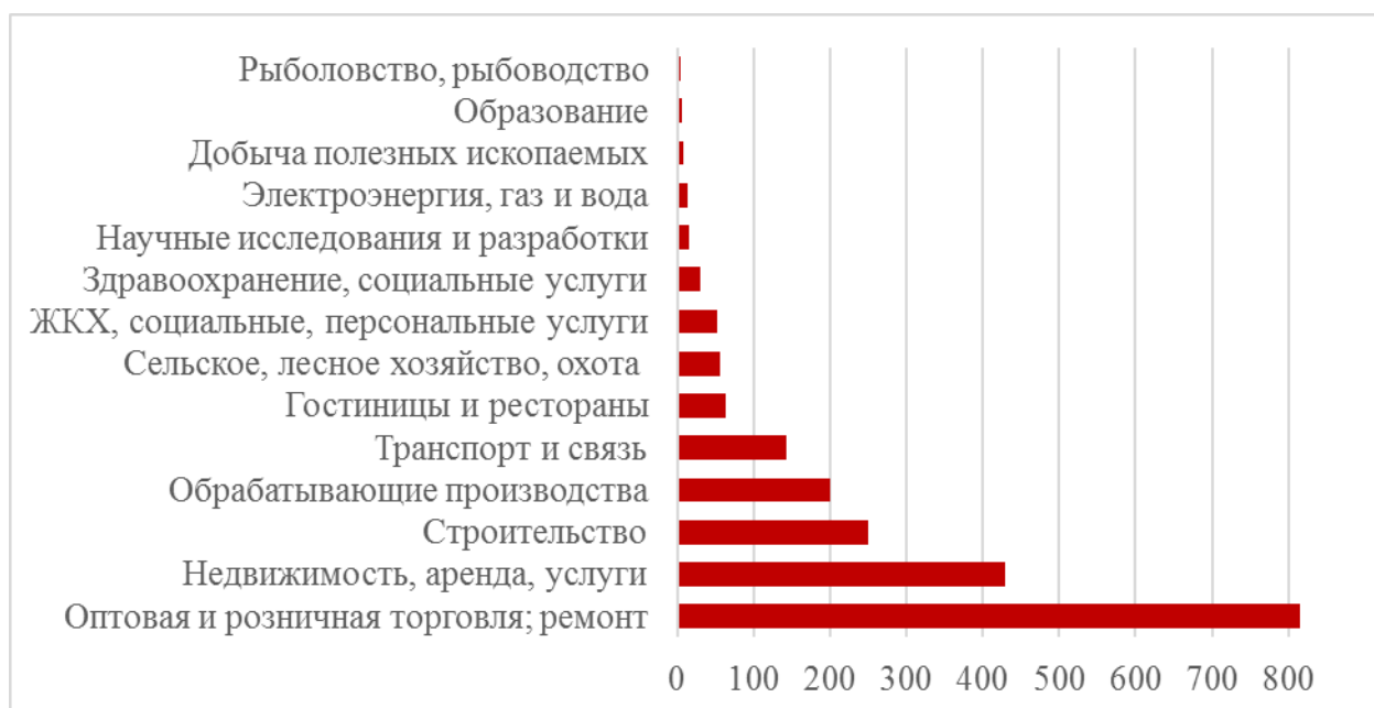
Рисунок 2 – Количество малых предприятий в 2015 г. (включая микропредприятия) по видам экономической деятельности в Российской Федерации, тыс. единиц [8]

Особенности ведения малого бизнеса (особенно для индивидуальных предпринимателей) в России позволяют пользоваться различного рода субсидиями, налоговыми послаблениями даже в сложных, нестабильных для страны условиях внешней среды. В частности, с 2016 года для таких субъектов введены налоговые и надзорные каникулы. Стоит отметить, что даже если годовой оборот ИП равен 0, всё равно приходится платить отчисления в страховые фонды (как минимум, 18610 руб. в бюджет пенсионного фонда и 3796 руб. в фонд обязательного медицинского страхования). Российские предприниматели, останавливающие бизнеса, но не закрывающие его, об этом часто забывают.