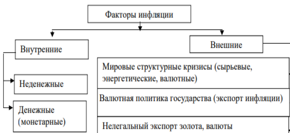
Рисунок 1 – Факторы инфляции

Выделяют внутренние и внешние факторы возникновения инфляции. Схематично это изображено на рисунке 1[3].