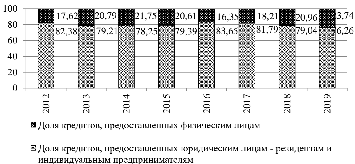
Рисунок 1 – Структура кредитов, предоставленных российскими банками клиентам за 2012-2019 года, %[4].

По данным рисунка 1 видно, что наибольшую долю на протяжении всех восьми лет составляют кредиты, предоставленные юридическим лицам – резидентам и индивидуальным предпринимателям. Это обусловлено, в первую очередь, не количеством кредитов, а размером предоставляемых ссуд, ведь в целях ведения бизнеса нужно привлекать достаточно большие объёмы денежных средств, а так как собственные ресурсы у данных экономических субъектов ограничены, им приходится использовать заёмные денежные средства [4].