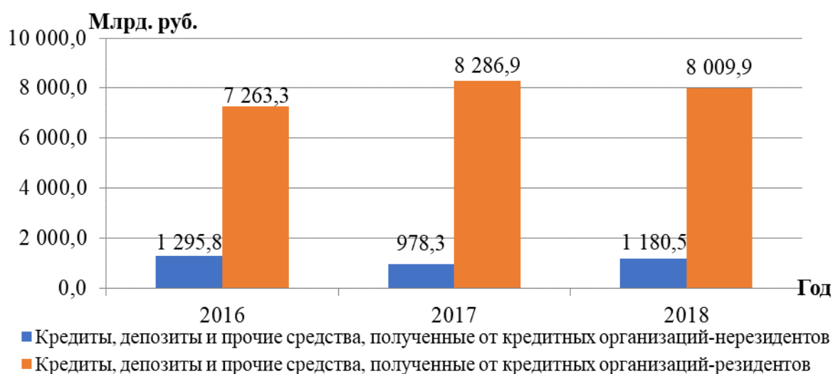
Рисунок 2 – Объем денежных средств, полученных от кредитных организаций-резидентов и кредитных организаций-нерезидентов, млрд. руб.[3]

По данным рисунка 2 можно сделать вывод о том, что наибольший объем кредитов коммерческим банкам на межбанковском кредитном рынке предоставлялся кредитными организациями-резидентами. В целом их объём в 2016-2018г.г. вырос на 746,6 млрд. руб. Так, в 2016г. он составил 7 263,3 млрд. руб., а в 2018г. – 8 009,9 млрд. руб.