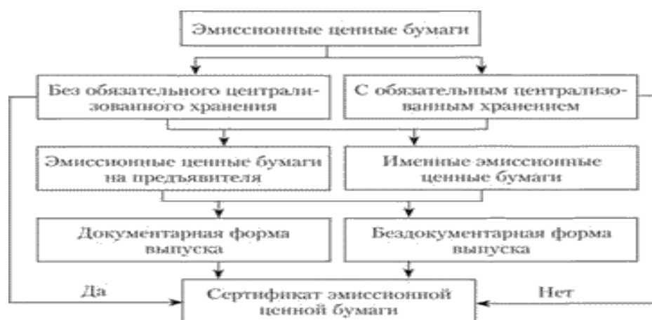
Рисунок 2 – Виды эмиссионных ценных бумаг в зависимости от места хранения [7]

В сфере эмиссии корпоративных ценных бумаг существует ряд проблем. Во-первых, это недостаточная поддержка компаний-эмитентов со стороны государства. Сюда можно отнести несовершенство нормативно-законодательной базы, недостаточный уровень развития инфраструктуры и налоговой системы и т.д. Во-вторых, это внутренние проблемы корпораций. До сих пор в России многие компании уделяют недостаточно внимания проработке и развитию инвестиционной культуры, формированию эмиссионной концепции и анализу эмитированных ценных бумаг.