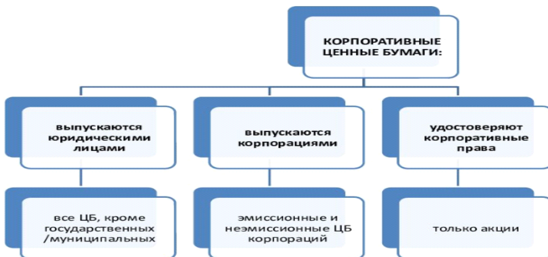
Рисунок 1 – Концепции сущности корпоративных ценных бумаг [6]

Термин «корпоративные эмиссионные ценные бумаги» продолжает использоваться, не имея легального и общепризнанного определения. В науке существуют три концепции. [3]