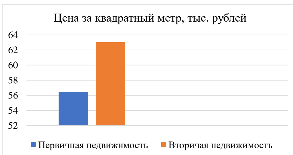
Рисунок 2 – Цена за квадратный метр жилья [3]

Основным минусом вторичной недвижимости Ростова-на-Дону по-прежнему является цена: она превышает цену за квадратный метр первичной недвижимости. Если говорить в абсолютных значениях, то в 2020 году средняя цена квадратного метра вторичного жилья Ростова-на-Дону составила 63 тысячи рублей, тогда как аналогичная цена первичной недвижимости составляет в районе 56,5 тысячи рублей (рис. 2).