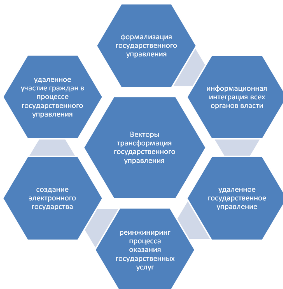
Рисунок 2 - Векторы трансформации государственного управления

Рассмотрим более подробно каждый из выделенных векторов трансформации государственного управления.