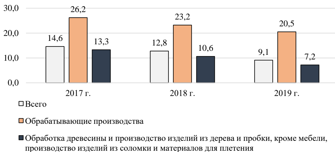
Рисунок 2 – Уровень инновационной активности предприятий в Российской Федерации, в том числе в отдельных отраслях промышленности, в 2017-2019 гг., % [9]

отраслей, так и от предприятий по России в целом (рис. 2). К тому же за последние три года, уровень показателя снизился почти вдвое и составляет всего 7,2%.